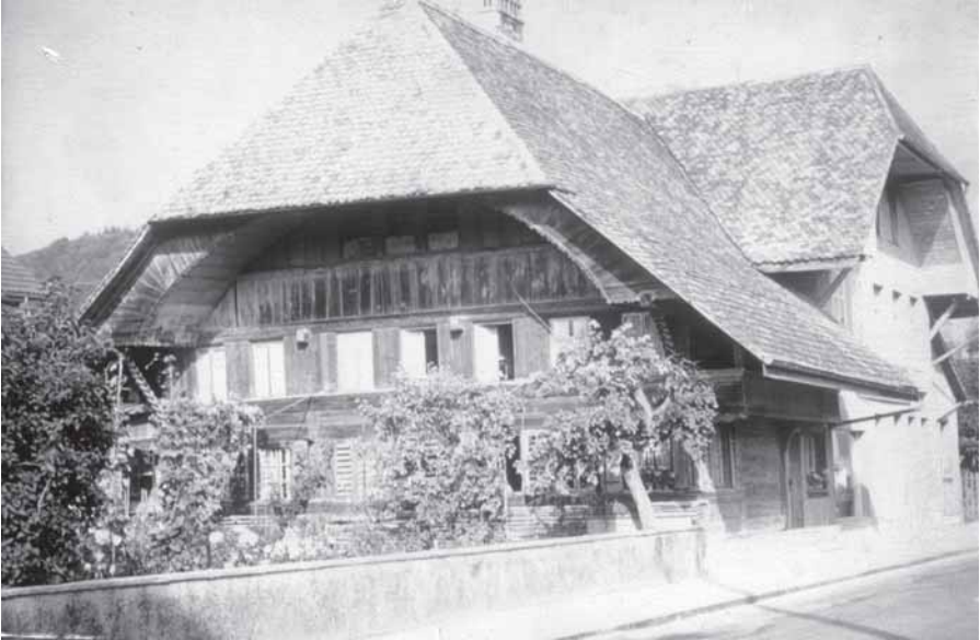
1961 Raub der Flammen: Das Wohn- und Geschäftshaus der Familie Brand an der Emmentalstrasse 72.